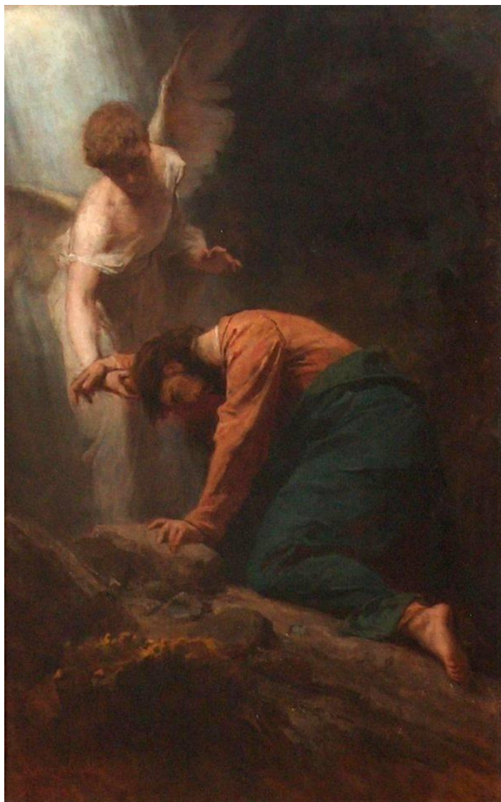
12. ábra - „Krisztus az Olajfák hegyén“, 1919

A prófétát még élteben megfestette a pusztában 1894-ben, de többet nem tudunk róla. A Strauss-opera 1905-ben íródott.