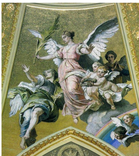
8. ábra - „Donna nobis pacem“ Szt. István bazilika

Kissé irritál, hogy a felállított tábla a jelenetet 1038 augusztusára teszi, hiszen csak egy egyházi szertartásról lehet szó. István király pár héten belül meghalt.