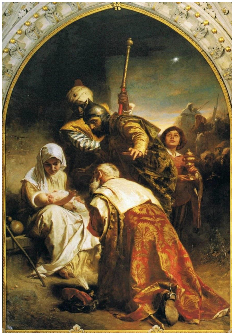
9. ábra - A fasori ev. templom oltárképe, „Napkeleti bölcsek”, 1913