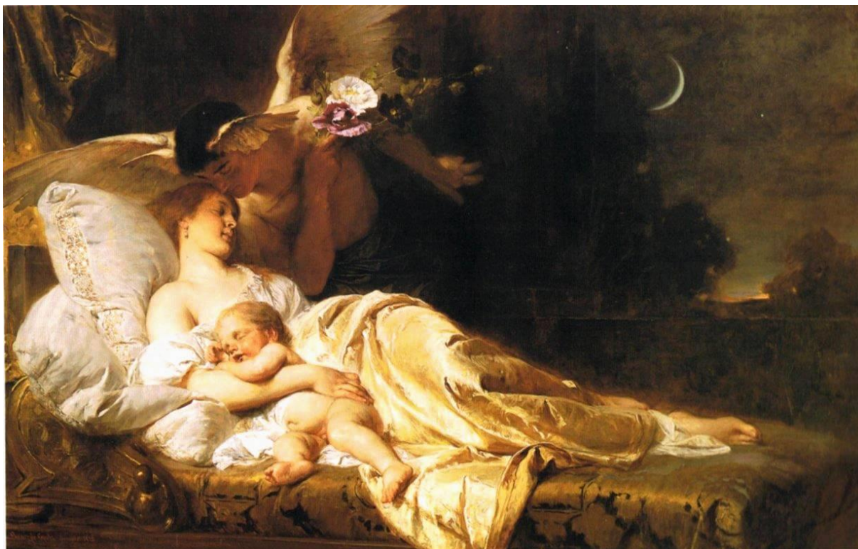
19. ábra - „Hypnos” (álom), 1920

A „Hypnos” vagy „Az álom” utolsó kompozíciója, 1920-ban fejezte be Dolányban, de a lehajló angyalt még Münchenből hozta magával. A függöny a festészetben hagyományosan az álom és az ébrenlét, az élet és a halál határát jelzi. A mitológia szárnyas istene mákvirággal a kezében álmot hint az asszony és gyermeke szemére. Minden vonal hibátlan, minden szín erőteljes, mint fiatal korában. Szébbet nem tudok mutatni, kivétve hagyom a képet és megköszönöm szíves figyelmüket.