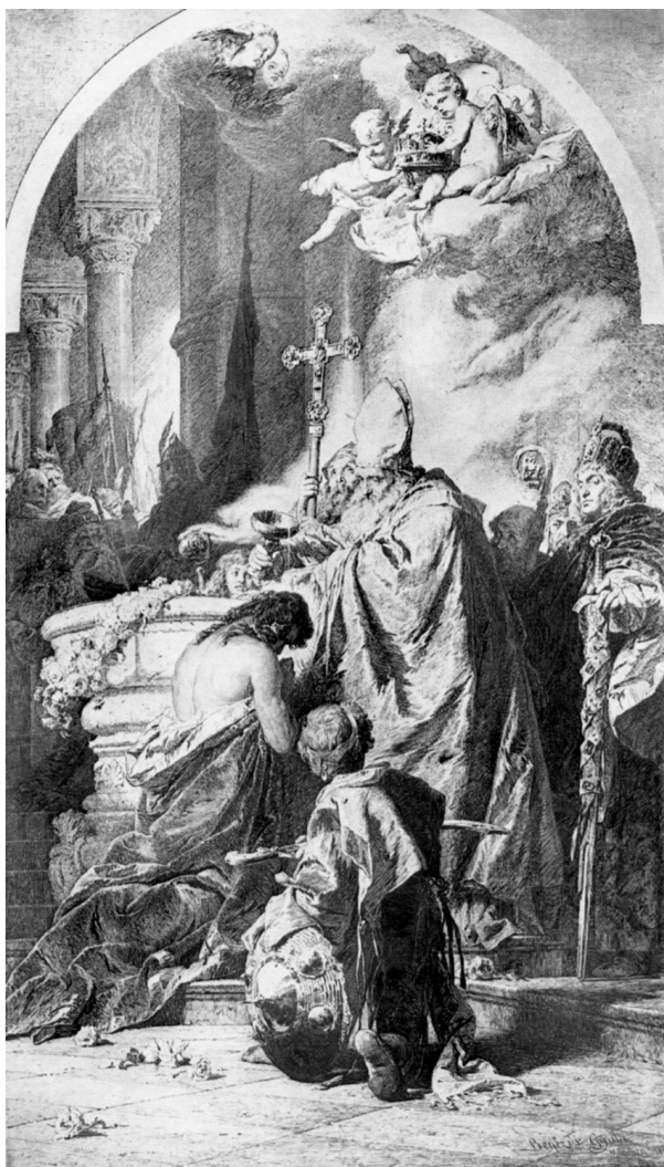
5. ábra -- „Vajk megkeresztelése” (tusrajz), 1880, MNG

tartják a szentkoronát. Meg vagyok győződve, hogy Tanár úr mesteri keze ezen hozzáadást igen szépen illesztette bele a csoportosításba. Ezen hozzáadás által azonban a kép szentképpé változik át, s mint ilyen confessionális jelleget ölt. Mint hogy pedig a mi társulatunknak ily jellegtől óvakodnia kell – mert tagjaink a legkülönbözőbb felekezetűek; minthogy továbbá tagjainknak Tanár úr képével egy nemzeti történeti képet ígértünk adni, igen óhajtandó lenne, ha tisztelt Tanár úr az angyalokat a koronával rajzából elhagyni, illetőleg törölni szíveskednék. Ezen óhajt osztja Ipolyi Arnold Ő Excellenciája is, kivel a dolgot a napokban Szent K...veten megbeszéltem.