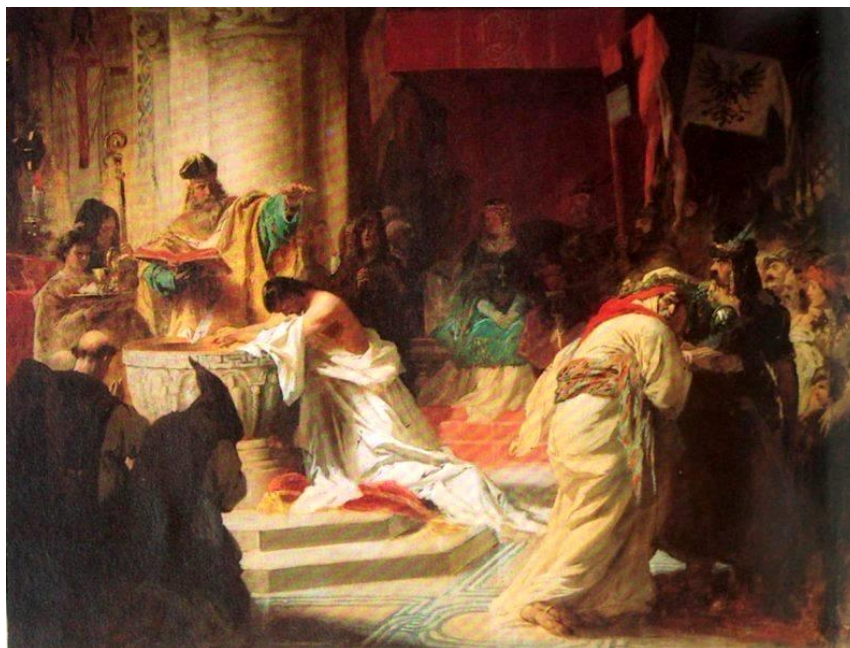
3. ábra - „Vajk megkeresztelése”, (olajvázlat), 1870, MNG

A következő vázlatkönyvben (70-72-es anyaggal) a színes díjnyertes kép ceruzarajzát találjuk, amely teljesen megegyezik a festménnyel. A kép sokkal lendületesebb, mint elődje, kivált a pogány magyarok ábrázolása.