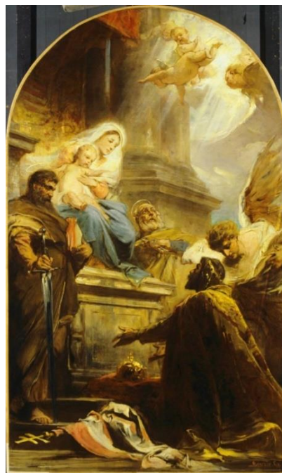
6. ábra- „Szt. István felajánlja a koronát Máriának” - (négy) olajvázlat, 1887-1906