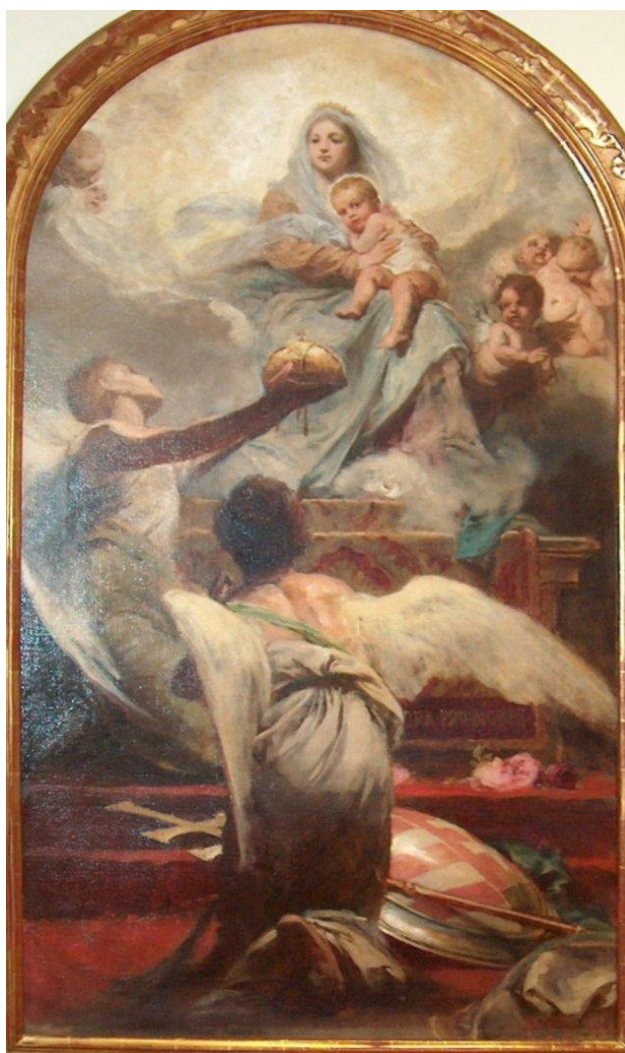
10. ábra - „Patrona Hungariae”, 1910-12, Nyíregyháza

Szervesen ide tartozik még egy megrendelése 1883-ból hazatérése után. Pauler Tivadar, akkor már a Tudományos Akadémia másodelnöke írja, hogy a kiküldött bizottság örömmel vette, hogy Benczúr kész megfesteni a tervezett magyar irodalomtörténeti ciklus első képét, amint Szent István fiának az intelmek könyvét átnyújtja, környezve Szent Gellért és a szerzetes tanítók által, a háttér homályában a nemzeti pogánykor lantosaival.