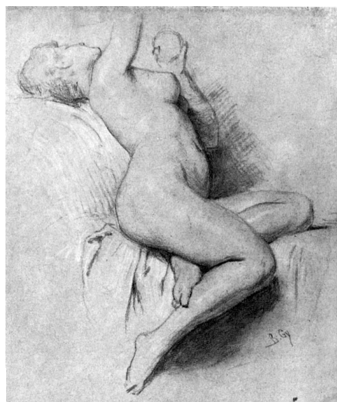
15. ábra - “Ádám és Éva”, rajz és vázlat, 1907, MNG

A magyar mitológiából is merített témát: a turul mondát Anonymus feljegyzésében. Emese álma, vagy Emese és a sas. Álmos fejedelem anyja volt. Száz évvel ezelőtt festette meg vázlatosan, nem rágalmazták hungarizmussal.