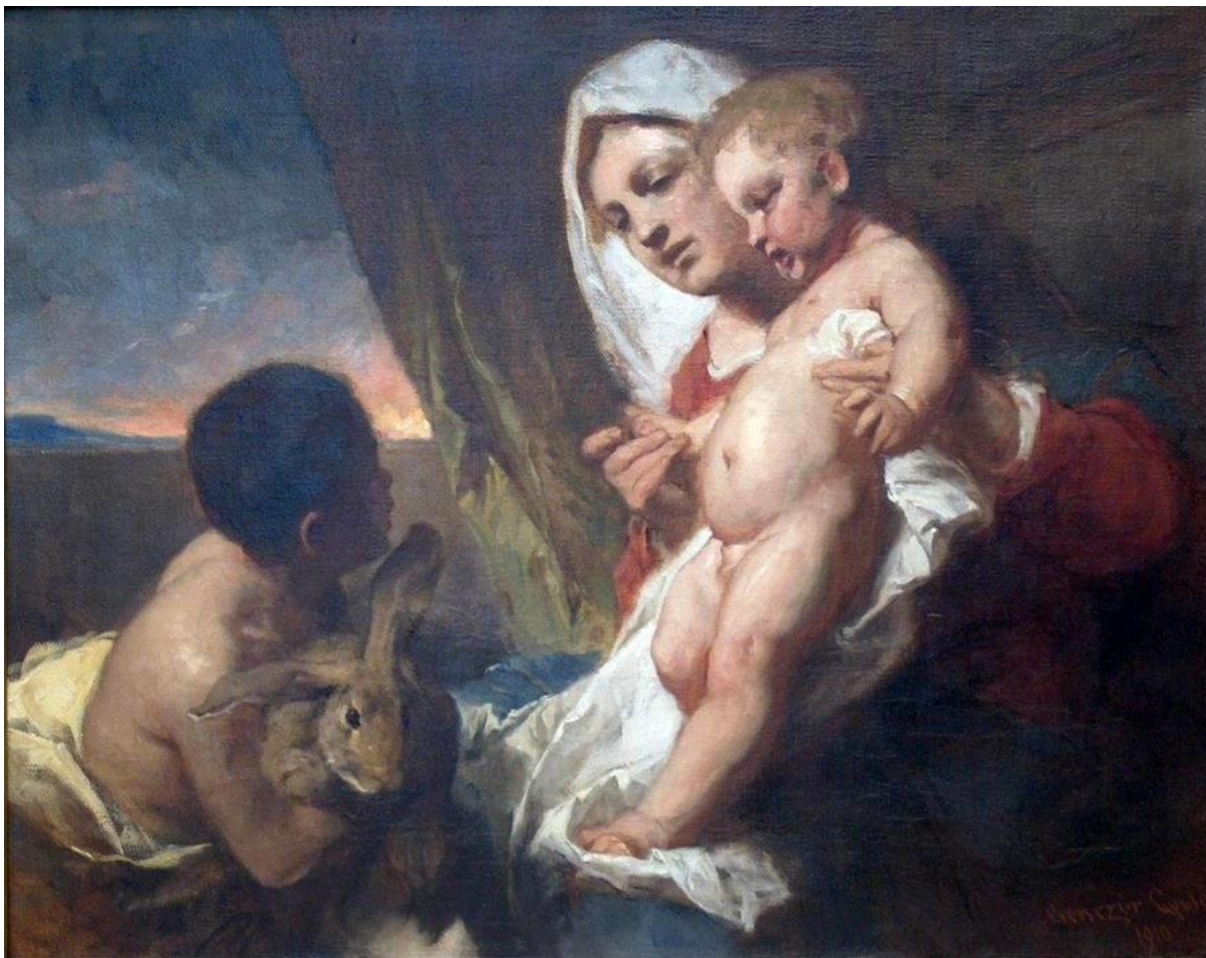
14. ábra - „Nyulas Madonna”, 1910, Nyíregyháza

Ádám és Éva-tervét nem dolgozta ki, de Éva rajza igen sikerült (15. ábra).