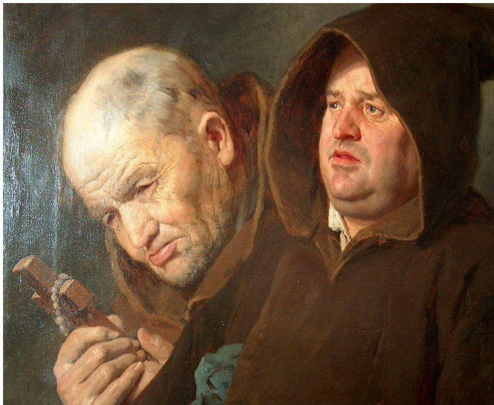
16. ábra - „Barátok“, 1874, Debrecen

Négy főpap arcképét is elkészítette, Ipolyi Arnold püspök a Képzőművészeti Társaság befolyásos tagja volt. Samassa bíboros egri érsek képét dicsérték. Minket jobban érdekel a „Furcsa szent”. Hock János pap egy barátja érdekében 1896-ban felkereste, hogy elérje, hogy ezen férfi bejusson egy kiállításra. A kép rossz volt és a zsűri leszavazta. Erre Hock megint megjelent, és megfenyegette, hogy a sajtó útján tönkre fogja tenni. Óriási vita indult a sajtóban, mely igen ártott a Mesteriskola hírnevének. Egy könyve is megjelent (Művészi reform). A tárgy maga talán nem volt érdektelen, de szerzője minden szakértelem nélkül fércelt össze kávéházi bölcsességeket. Benczúr szóban nem foglalt állást, hanem megfestette Lucifer pózban, amellyel nagy port vert fel.