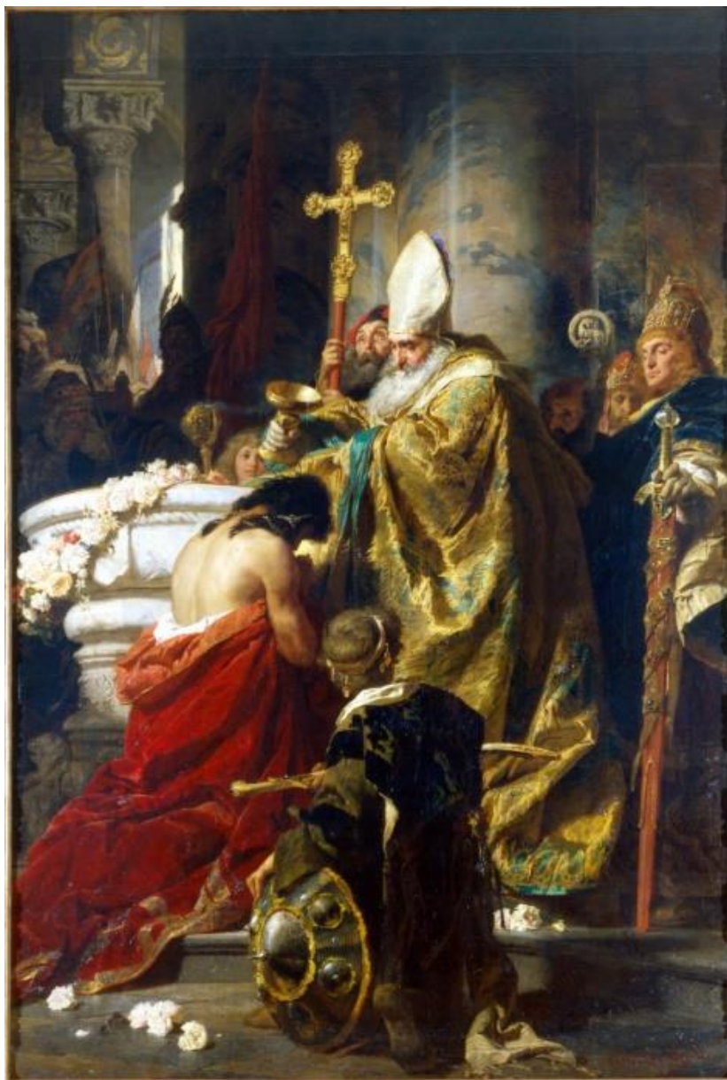
4. ábra - „Vajk megkeresztelése”, 1875, MNG

Benczúr 1871-ben levélváltásban meg-egyezik Eötvös utódjával, Pauler Tivadarral a kép kivitelezésében (alku után 3000 Ft-ért) féléletnagyságban, kétévi munkaidőt kérve. Paulert a híresebb Trefort Ágoston váltja, s vele is levelet vált ismeretlen tartalommal (esetleg a méret, vagy a változások?) 1872 végén elkezdí festeni a nagy képet, számos tanulmány után (a püspök alakja az említett vázlatkönyvből pár oldallal tovább). Egyik levelében ezt írja haza: Mint a bolond állok a vászon előtt és nem tudom, hogy hol a hiba. A kép 1875-re készült el másfél élelnagyságban (4. ábra), és óriási sikert aratott, a művész harminc éves. Mindmáig folyik a vita, hogy miért változtatott ennyit a kompozíción. A rosszmájúak azt mondták, hogy behódolt a feudál-burzsoa rendszernek, a Habsburgoknak, stb. Rózsa Gyula, Bellák egyik tanára írja 2001-ben: