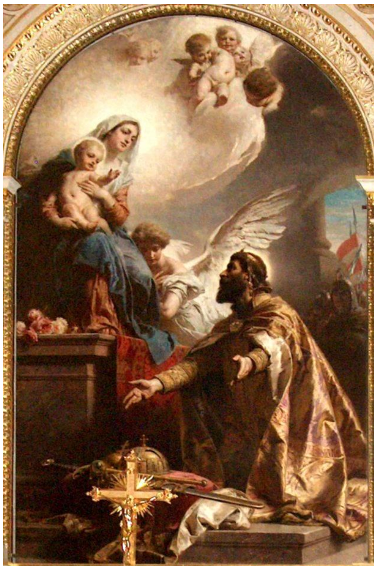
7. ábra - „Szent István felajánlja a koronát Máriának“, 1906, Szt. István bazilika

A Bazilika, vagy Lipótvárosi templom oltárképe szokatlan hosszú ideig, 20 éven át foglalkoztatta. A templom maga vagy 50 évig épült, közben a kupola összedőlt és az építkezés sokáig szünetelt. Négy változat után végre elkészült a végleges megoldás és 1906-ban utolsó díszként került a csak magyar művészek által alkotott művek közé. Az első vázlatokon Péter és Pál apostolokat is ábrázolta, a színes vázlat (6. ábra) különösen megnyerő, nem vallott volna szégyent vele mai ízlésünk szerint. Számos rajzvázlatban is kereste a helyes mozdulatokat. A főoltár mögött egy István-szobor áll, a kép a jobb oldalon egy szép oltár keretében kapott helyet (7. ábra), egyszerűen gyönyörű, itt is leegyszerűsítve a főszereplőkre.