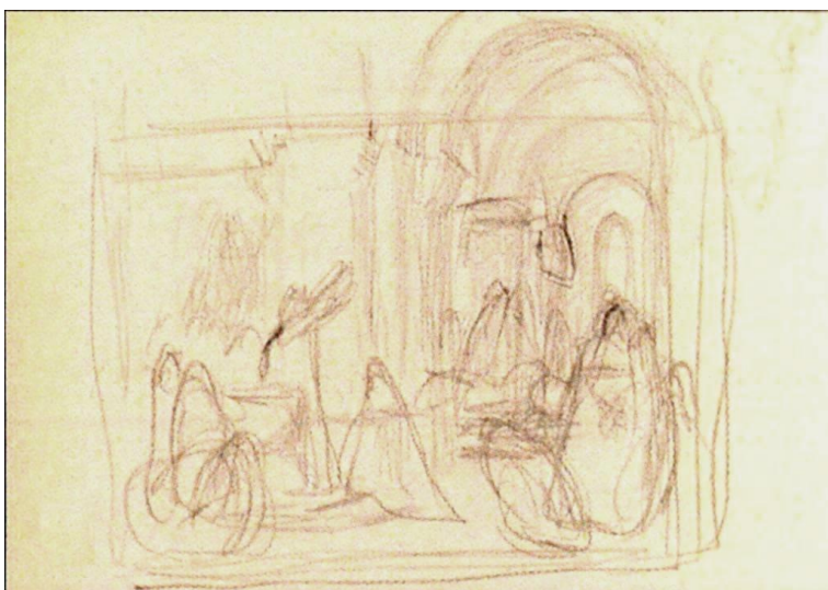
1. ábra – „Vajk megkeresztelése” első rajzvázlata, 1869, magántulajdon

Egy templomi jelenet látható – egy határozott vonal levágja a boltívet, téglalap