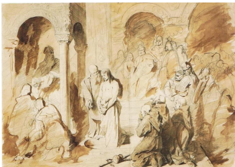
2. ábra – „Vajk megkeresztelése” első szépiavázlata, 1869, Magyar Nemzeti Galéria