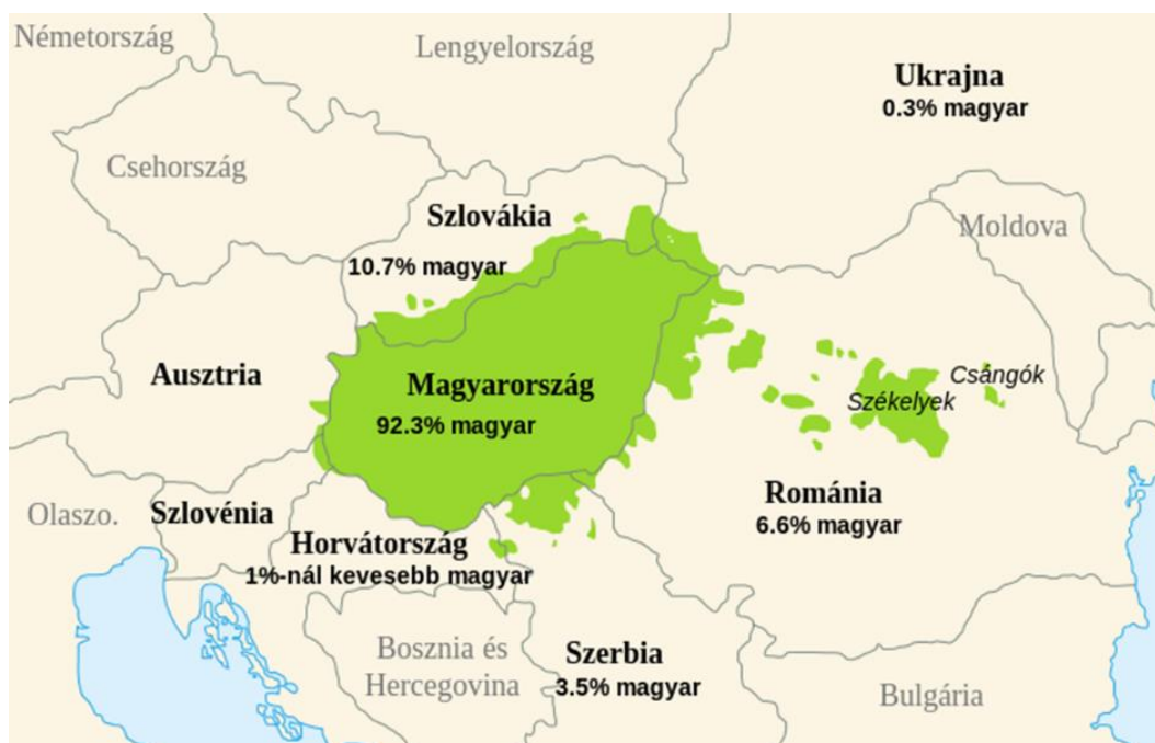
A magyarság százalékos eloszlása területileg

A „csángó” több Romániában élő magyar nyelvű kisebbségi népcsoport összefoglaló neve.