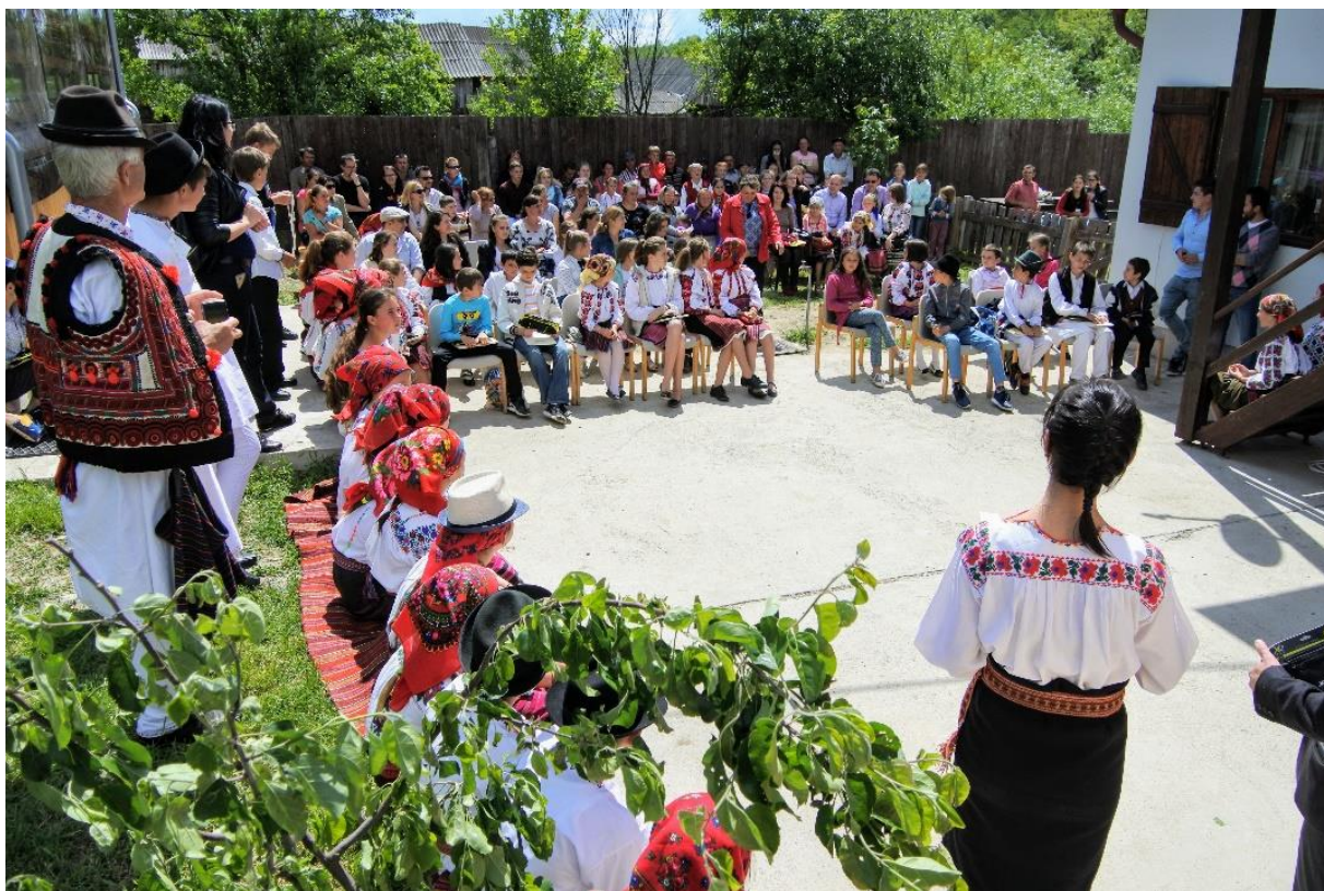
III. Lakatos Demeter szavalóverseny, Lábnyik, Magyar Ház udvara

Életem egy igazán meghatározó időszaka volt.